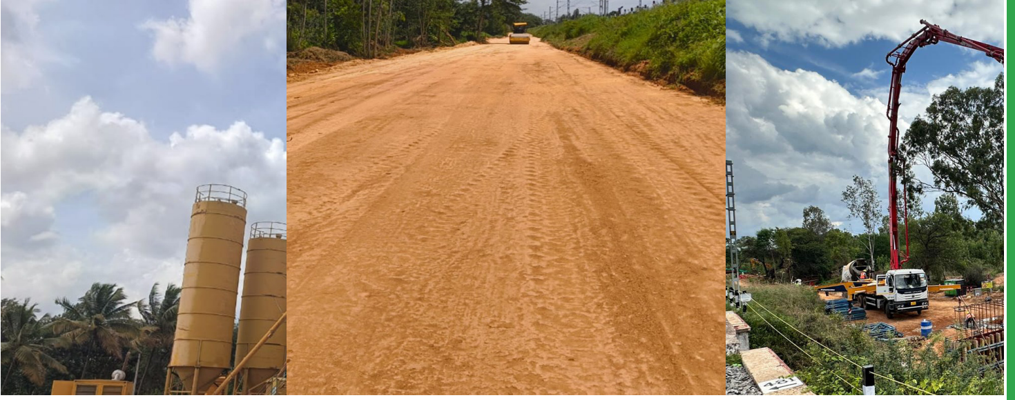
ಕಾಸ್ಟಿಂಗ್ ಯಾರ್ಡ್‌ನಲ್ಲಿ ಬ್ಯಾಚಿಂಗ್ ಪ್ಲಾಂಟ್ ನಿರ್ಮಾಣ, ಸಣ್ಣ ಸೇತುವೆಗಳ ನಿರ್ಮಾಣ, ಕಾರಿಡಾರ್-4 ರಲ್ಲಿನ ಭೂಮಿ ಕಾಮಗಾರಿಗಳು ಪ್ರಗತಿಯಲ್ಲಿವೆ.